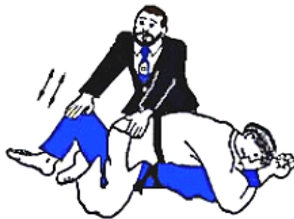
SONO-MAMA ⇄ YOSHI