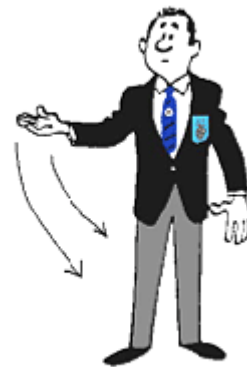
POZIV ZA ZDRAVNIKA