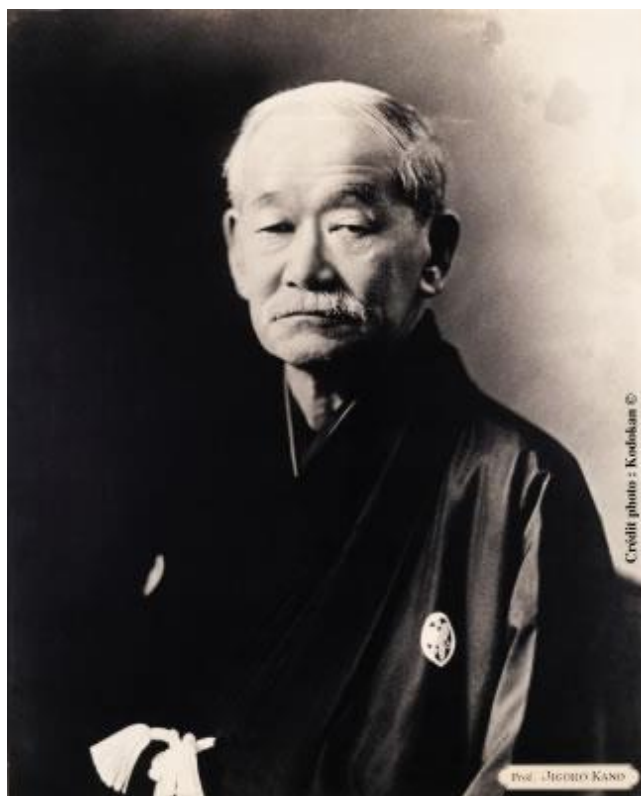
Jigoro Kano – ustanovitelj juda